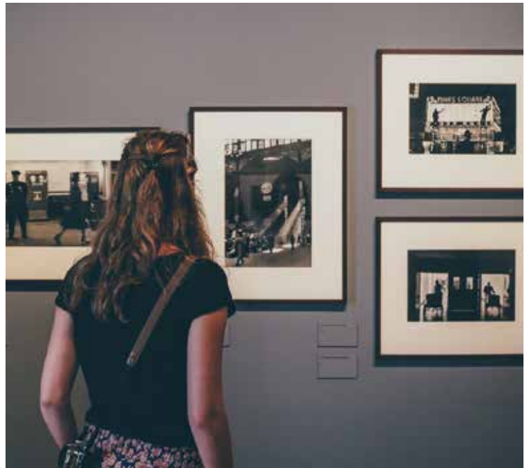
Sabine Weiss au Château de Tours

A vocation militaire et défensive hier, il est aujourd'hui un lieu culturel majeur de la ville. Il y héberge des expositions d'ampleur nationale et accueille - depuis 2010 - une partie des fonds photographiques du prestigieux Musée National du Jeu de Paume. Entre 30 000 et 50 000 visiteurs par an viennent profiter de sa programmation touchant tous les domaines de la création: peinture, photographie, poterie, sculpture, archéologie, art contemporain... Dernièrement, les expositions des œuvres photographiques de Robert Capa et de Sabine Weiss ont rencontré un véritable succès auprès du public.