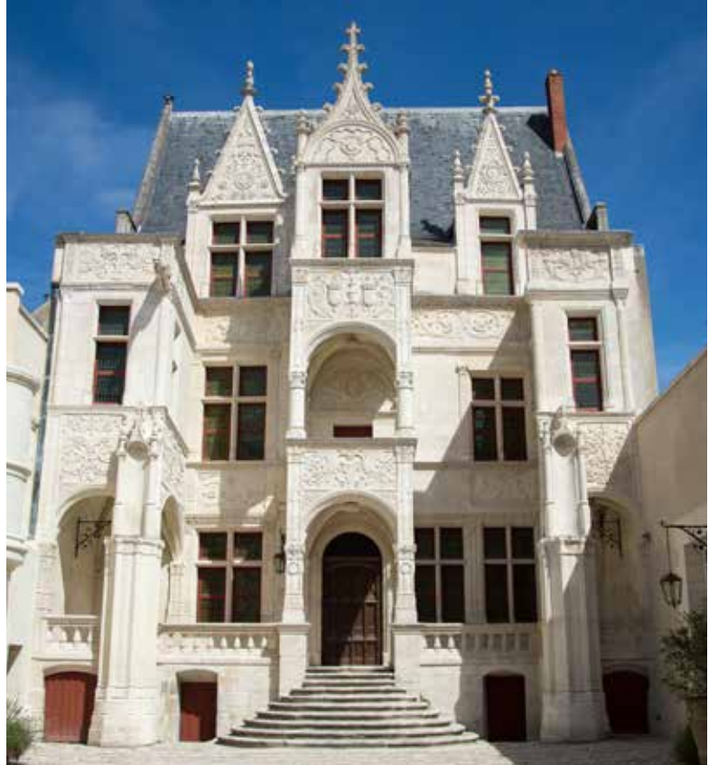
l'Hotel Gouin

Très rare vestige de l'architecture Renaissance à Tours, cet ancien hôtel particulier a appartenu à un marchand de soieries au XV ème siècle, puis aux Gouin, riche famille de banquiers, en 1738. Sa façade sculptée de rinceaux et sa tour d'escalier font d'elle l'une des plus belles demeures Renaissance de la ville. Elle sert aujourd'hui d'écrin à des expositions temporaires.